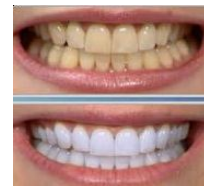
Результат действия отбеливающих стрипов